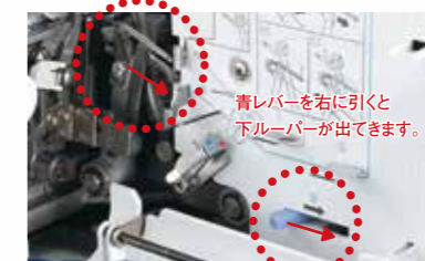
青レバーを右に引くと 下ルーバーが出てきます。

レバー操作で、下ルーバーを糸通しがしやすい位置に移動できます。糸を通すところがしっかり確認できるから、迷わず糸通しできます。